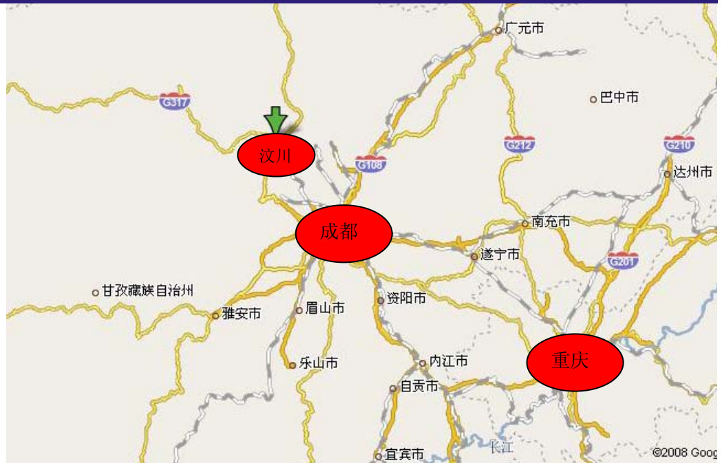
图 1: 震中汶川及周边城市地图

目前受灾较严重的地区主要是与震中相距较近的在四川北部城市与重庆，其他地区尚无重大损失报道。